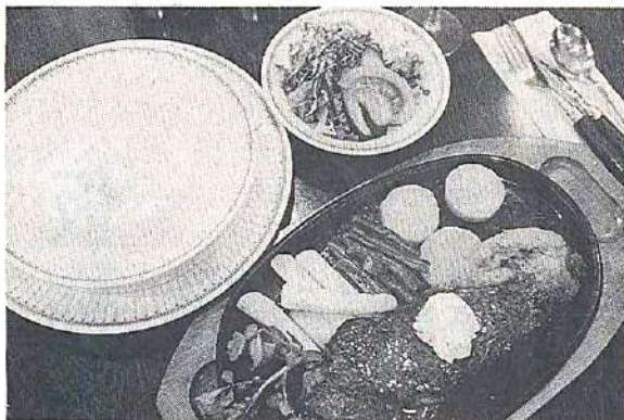
常陸牛サーロインにサラダとスープがついた「ステーキ日セット」（2800円）