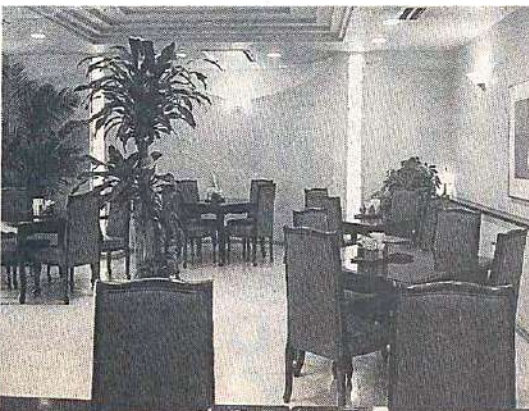
余裕のある空間を演出する店内